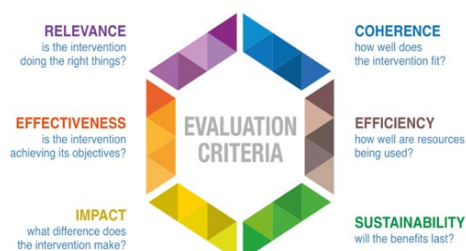
Figure 1 – Disponible en anglais uniquement

b) fournir des informations d'évaluation fondées sur des preuves pour soutenir le processus de prise de décision du Comité du développement et de la propriété intellectuelle (CDIP).