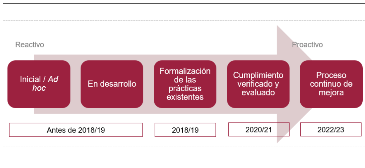
Cuadro 3: Marco temporal para la hoja de ruta de la OMPI contra el fraude