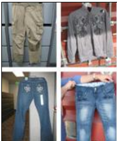
Пример контрабанды одежды с использованием ЗВТ, расположенной в районе Лос-Анджелеса 12 .

11. Бывают даже такие случаи, когда в торговых зонах для посетителей им могут без их ведома предлагаться контрафактные товары 13 .